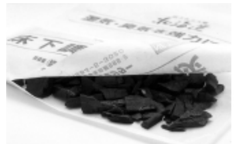
複合不織布“ストラマイティ”を用いた製品例 (炭袋用包材・微粉末対応)

ブース展示も3コマと設備同様コンパクトではありますが、熱意と発想力では負けません。皆様のご期待に必ずやお応えできると確信しております。まずは、B-1204にお立ち寄り下さい。心よりお待ちしております。最後に皆様が明日のパートナーになっていただけることを祈っております。