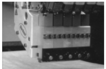
ユニバーサルスプレーガン

ターンの状態を確認していただきます。またバーサブルーメルターやユニバーサルスプレーガンを展示し、操作性、メンテナンス性の良さを確認していただきます。