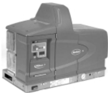
プロブルーメルター

パッケージング用機種として開発されたホットメルト用アプリケーションシステムです。シンプルなコントロールパネルと簡単な操作性、また信頼性の高いピストンポンプを搭載することにより安全性に優れています。