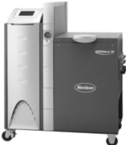
バーサブルーメルター

プロダクトアッセンブリー用機種として開発されたホットメルト用アプリケーションシステムです。安定した塗布能力と操作性・メンテナンス性に優れています。