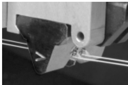
シュアラップスプレーガン

ノズルに糸ゴム横振れガイドを設けホットメルトを正確に塗布することにより、接着強度が均一となりより良いギャザーを作る事が出来ます。